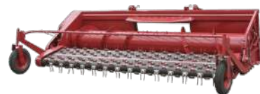
Подборщики зерновые LAGARD