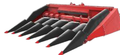
Жатка для уборки кукурузы на зерно STORK