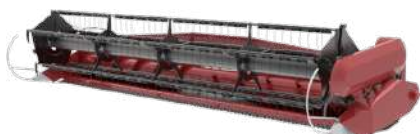
Жатки для уборки зерновых культур и сои BARST / TANZER