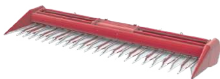
Жатки для уборки подсолнечника SUNRISE / TURON