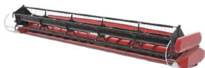
Жатки для уборки зерновых культур BARST / TANZER