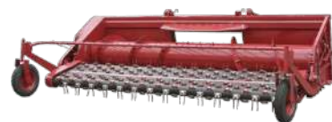
Подборщики зерновые LAGARD